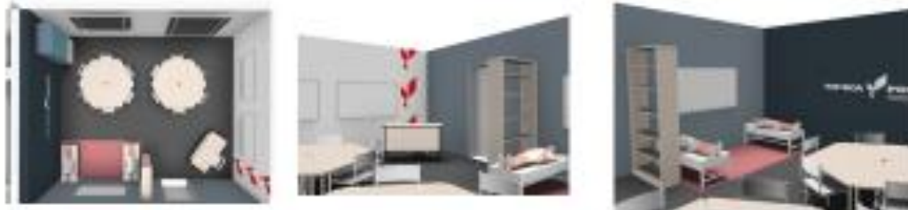
3 кабинет- информатика