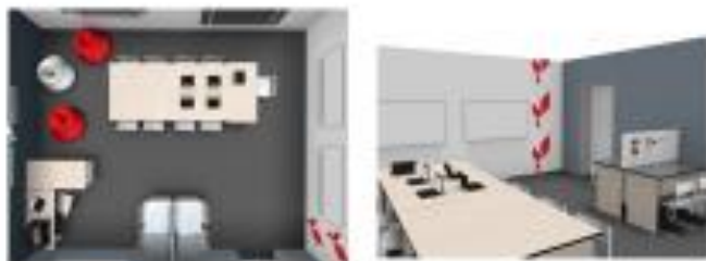
1 кабинет – технология